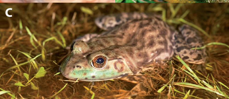
Geen ruglijsten aanwezig